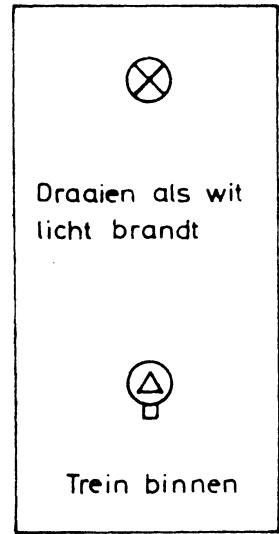
Geplaatst op het perron