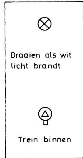
Geplaatst bij wl 3A/B